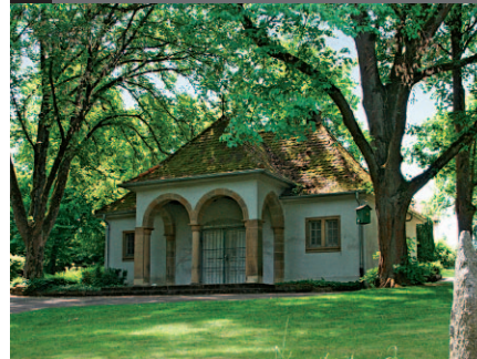
4 Alter Friedhof Bissingen